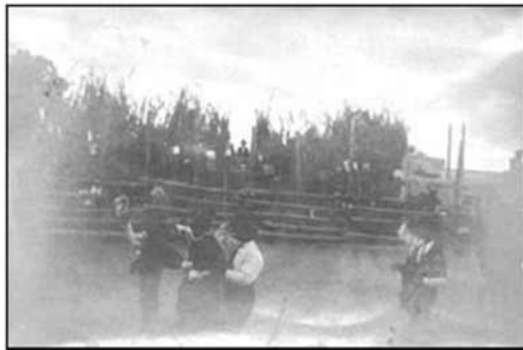
Antigua Plaza de toros en San Buenaventura en el año de 1906

Las corridas de toros con matadores profesionales se celebraban durante los 4 domingos del mes de septiembre, en lo que vendrá a ser las primeras ferias de San Buenaventura.