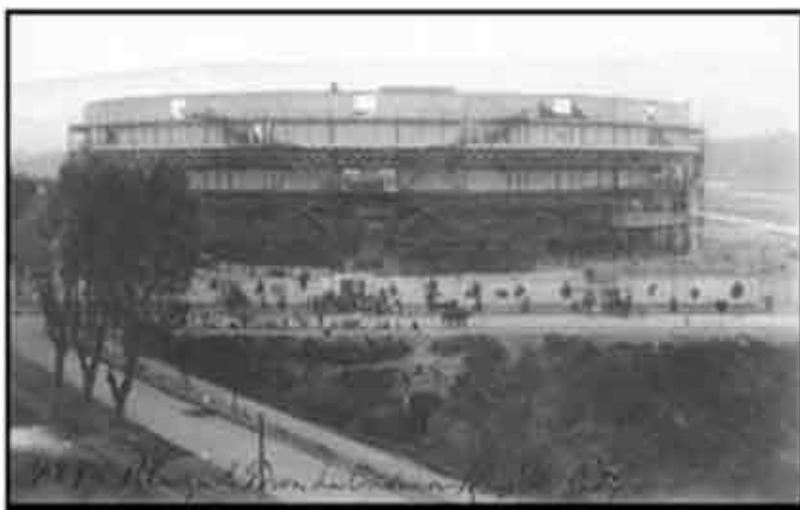
Antigua Plaza de Toros “La Condesa” del Torero en México D. F.